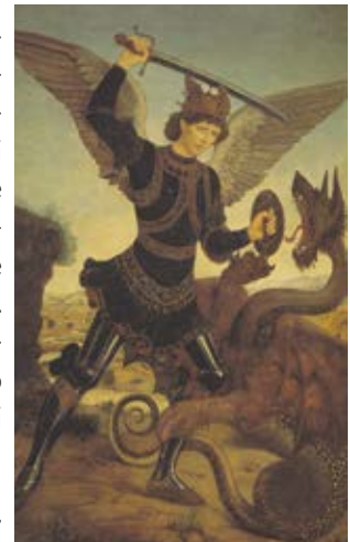
San Michele arcangelo e il drago Antonio del Pollaiuolo (1498) Museo Bardini - Firenze

L'articolo integrale è disponibile sul sito di TuttoRaggiolo ( tutoraggiolo.it ).