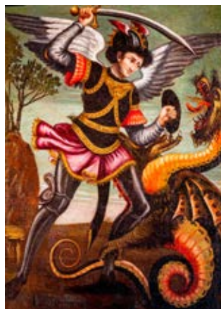
Tela di San Michele Sebastiano Pontenani (1630) Pieve di Raggiolo

Negli anni Trenta del Seicento, in piena epidemia di peste, la comunità di Raggiolo rinnovò la devozione al suo patrono commissionando una tela a Sebastiano Pontenani , pittore aretino. L'opera, datata intorno al 1630, raffigura l'Arcangelo nell'eterna lotta contro il Male, con valenza apotropaica e votiva. Pontenani si ispirò allo stendardo processionale di Antonio del Pollaiuolo (1460-70), ammirato da Vasari, reinterpretandone i dettagli con maggiore na-