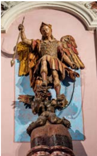
Statua lignea San Michele Anonimo scultore fiorentino Pieve di Raggiolo

La pieve di San Michele a Raggiolo custodisce due preziose raffigurazioni dell'Arcangelo in lotta contro il demonio: una scultura lignea policroma e una tela seicentesca. Il gruppo scultoreo, restaurato nel 2000, è stato attribuito alla cerchia fiorentina dei Nigetti , collaboratori di Vasari , per affinità stilistiche e rimandi vasariani, in particolare nella figura del demonio, simile a quella incisa da Diana Scultori nel 1588 su disegno di Vasari. L'opera, ispirata all' Apocalisse di Giovanni , rappresenta San Michele nell'atto di incatenare Satana , con un demonio dalle fattezze grottesche e bestiali che ricordano l'antico demone orientale Pazuzu . Databile tra la fine del XVI e l'inizio del XVII secolo, nasce nel fervido ambiente culturale fiorentino, in cui arte, teologia e filosofia dialogavano intensamente.