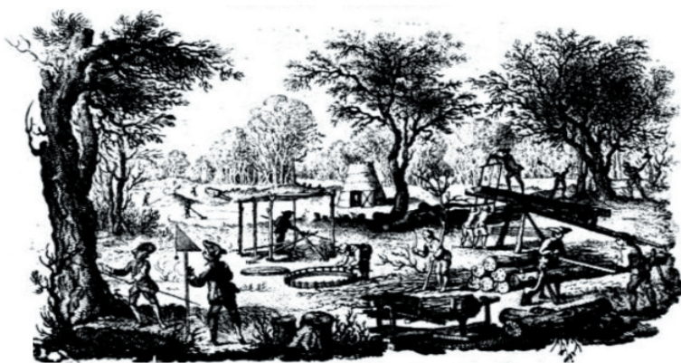
Immagine tratta da "Del governo dei boschi, ovvero mezzi per ritrar vantaggio dalle macchie e da ogni genere di piante da taglio, e di far loro una giusta stima". Del Signor Duhamel de Monceau, Venezia MDCCCLXXII.

In conclusione, la storia di Raggiolo, dal XIX secolo fino ai giorni nostri, è una testimonianza della capacità delle piccole comunità di adattarsi ai cambiamenti preservando, al tempo stesso, la propria identità.